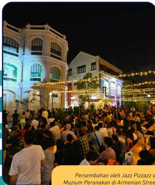
Persembahan oleh Jazz Pizzazz di Muzium Peranakan di Armenian Street semasa Pesta Malam Singapura.