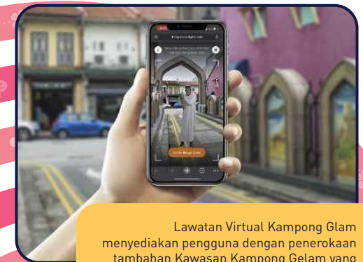
Lawatan Virtual Kampong Glam menyediakan pengguna dengan penerokaan tambahan Kawasan Kampong Gelam yang bersejarah menggunakan replika digital.