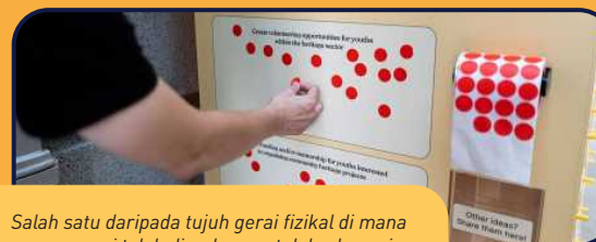
Salah satu daripada tujuh gerai fizikal di mana orang ramai telah diundang untuk berkongsi idea dan cadangan mereka untuk HP2.

Maklum balas orang ramai dan pihak berkepentingan adalah penting dalam mewujudkan pelan induk yang lebih inklusif dan bersepadu untuk masa depan sektor warisan kita.