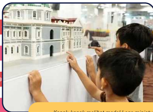
Kanak-kanak melihat model Lego miniatur Muzium Negara Singapura sebagai sebahagian daripada pameran bergerak, Sejarah Bangunan: Monumen dalam Blok dan Kepingan.